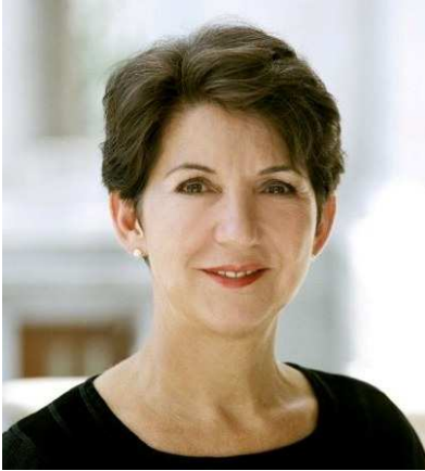
Nationalratspräsidentin Mag. a Barbara Prammer